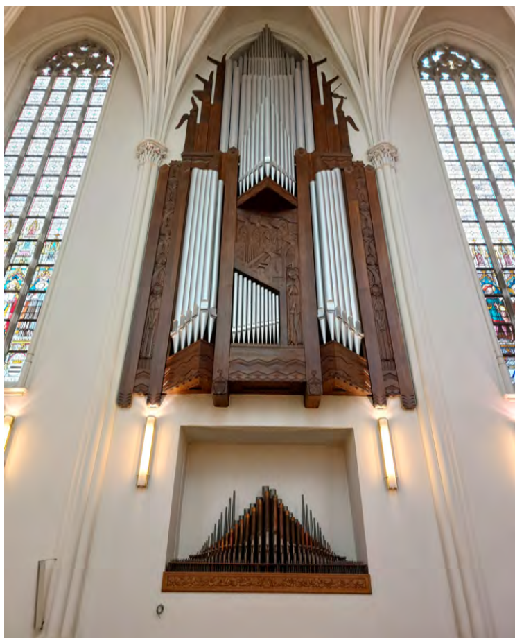
Hedendaagse situatie