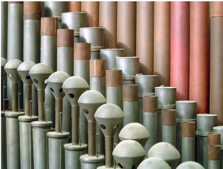
Detail pijpwerk Onderwerk