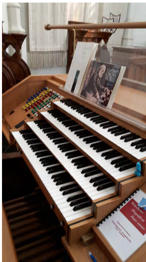
Huidige speeltafel (sedert 1999)